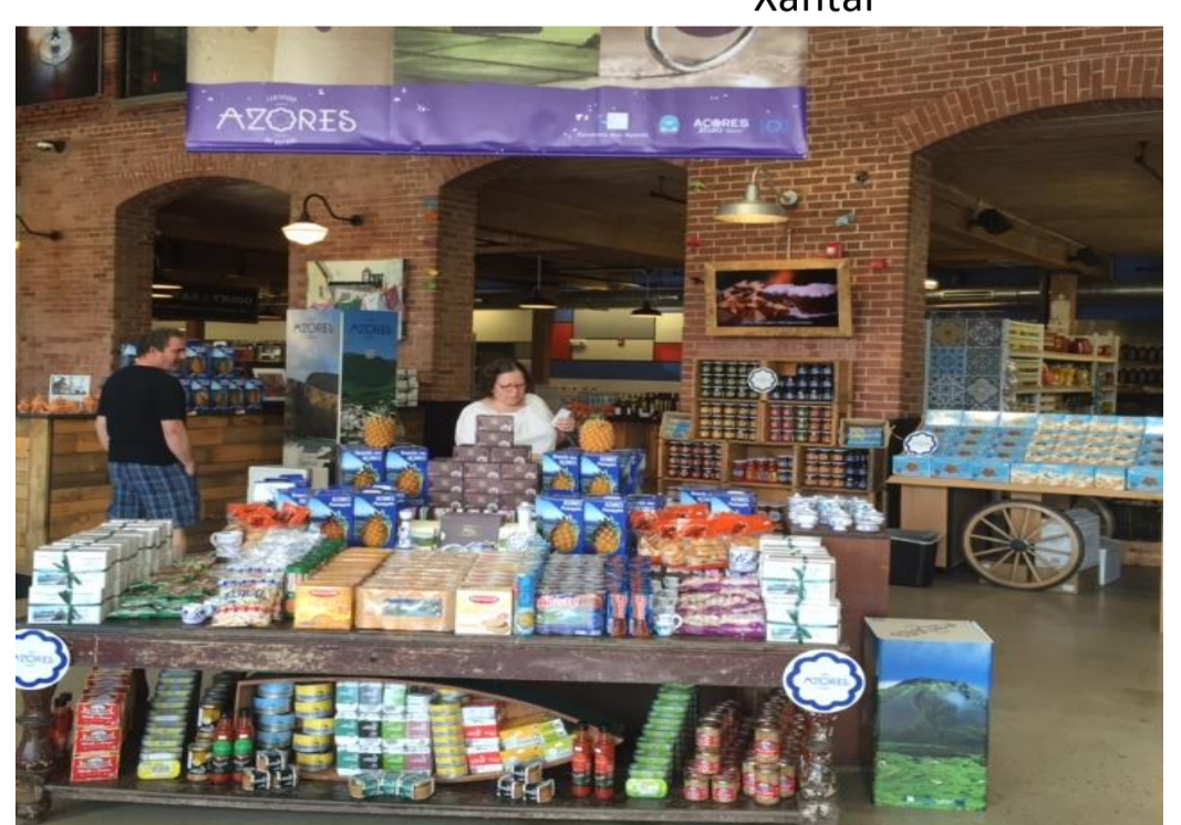
Publicidade EUA (Video)